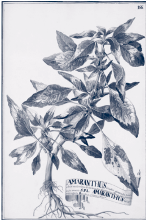
Die Abbildungen in dieser Broschüre sind Details aus Brüdern Bauer, «Amaranthus tricolor», um 1779